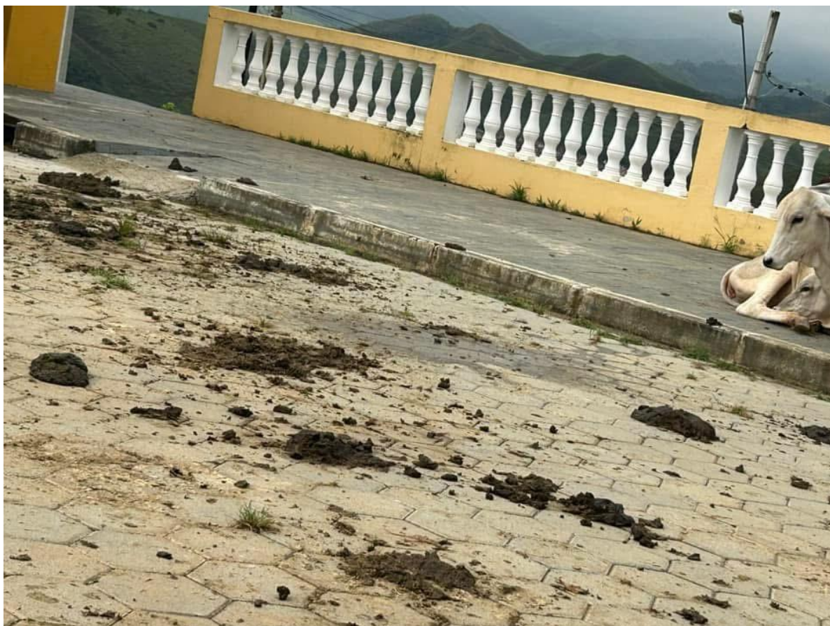
Imagem nº 1